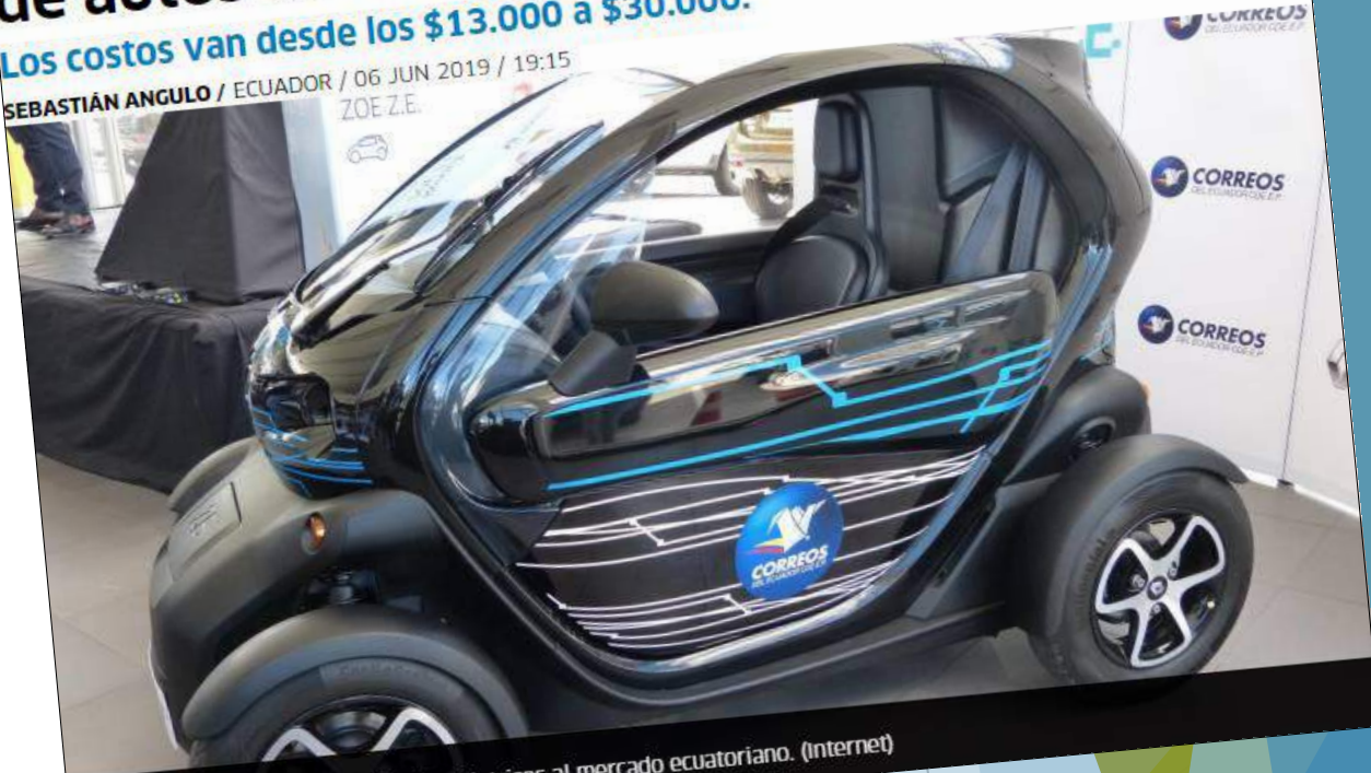
La marca Renault ofrece vehículos eléctricos al mercado ecuatoriano.

SEBASTIÁN ANGULO / ECUADOR / 06 JUN 2019 / 19:15 ZOE Z.E.