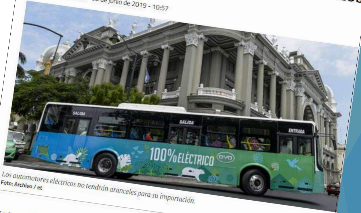
Los automotores eléctricos no tendrán aranceles para su importación.

Redacción Economía - 05 de junio de 2019 - 10:57