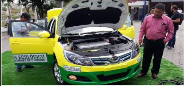
El auto eléctrico fue construido por la empresa BYD, firma que también participó en la provisión de la flota de 30 buses en la misma modalidad.

Redacción Ecuador Regional - 25 de abril de 2019 - 00:00