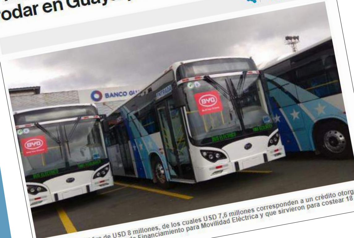
La inversión total fue de USD 8 millones, de los cuales USD 7,6 millones corresponden a un crédito otorgado por la CFN dentro de su línea de Financiamiento para Movilidad Eléctrica y que sirvieron para costear 18 unidades.

Martes, 20 de agosto de 2019 Síguenos: f t v i